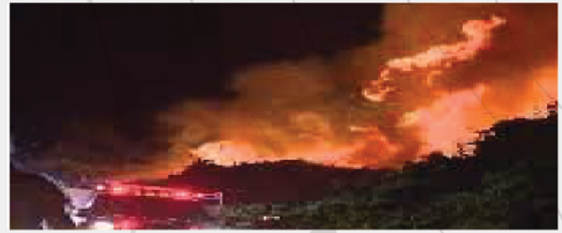
Incendio en American River, Sacramento

Durante un incendio pueden emitirse órdenes de evacuación, escuche los canales de emergencia y los pronósticos del tiempo, es importante que conozca el estado y ubicación del fuego, mantenga a mano los documentos más importantes y los artículos de su kit de emergencia; preferiblemente dentro de su vehículo o en un lugar a la mano en el interior de su vivienda.